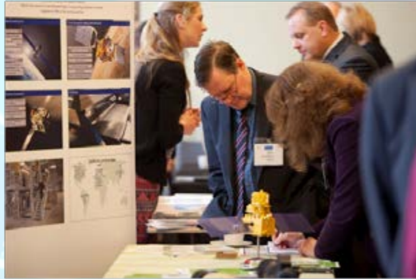
Ymwelwyr a stondin cwmni Cymdeithas Ddysgedig Cymru